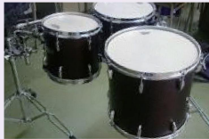
有馬高校 コンサートトム購入