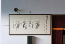
横須賀大津高校 校歌額とトイレ改修