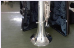
平塚中等教育学校 チューバ購入