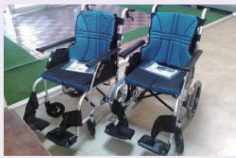
湘南養護学校 車椅子購入